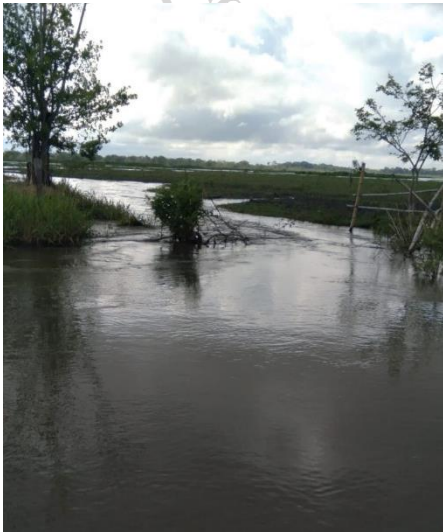
Canalización en la ciénaga La Cantagallera