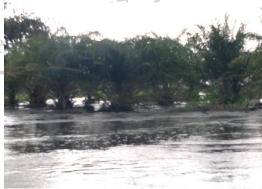
Monocultivos de palma africana en el complejo de humedales Miraflores.