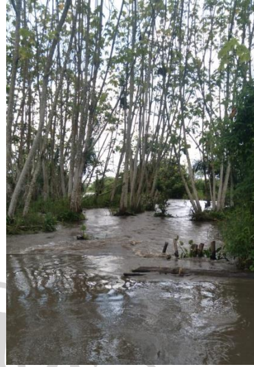
Canalización en la ciénaga La Catalina.