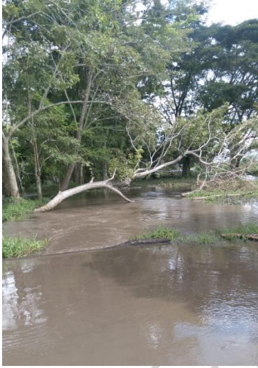
Canalización en la ciénaga La Catalina.

CREDHOS Corporación Regional para la Defensa de los Derechos Humanos "Hoy como ayer, persistiendo por la vida y la dignidad" NIT. 800.079.235-6