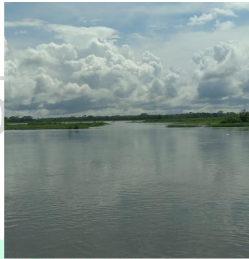
Canalización en la ciénaga Chiribital.