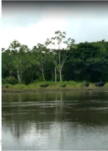
Ganadería bufalina en la ronda hídrica del complejo de humedales Miraflores.