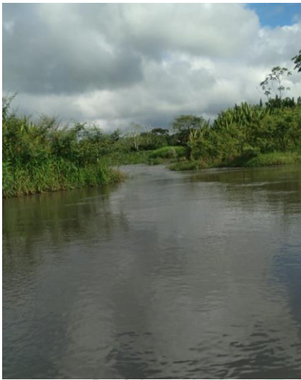
Canalización en la ciénaga Mañe Feria.